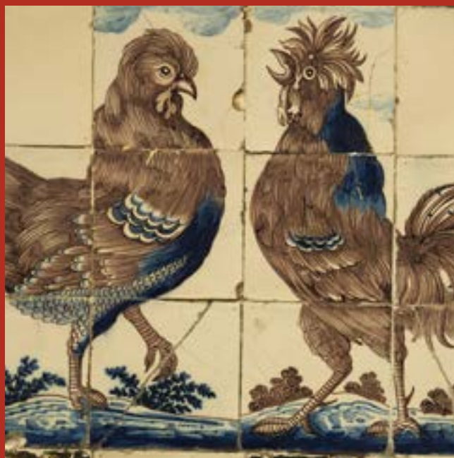
Carreaux de faïence de l'arrière-cuisine