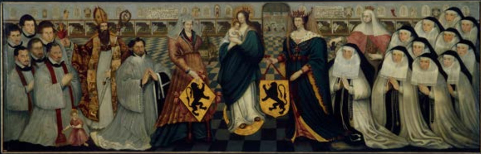
La fondation de l'hôpital, 1632