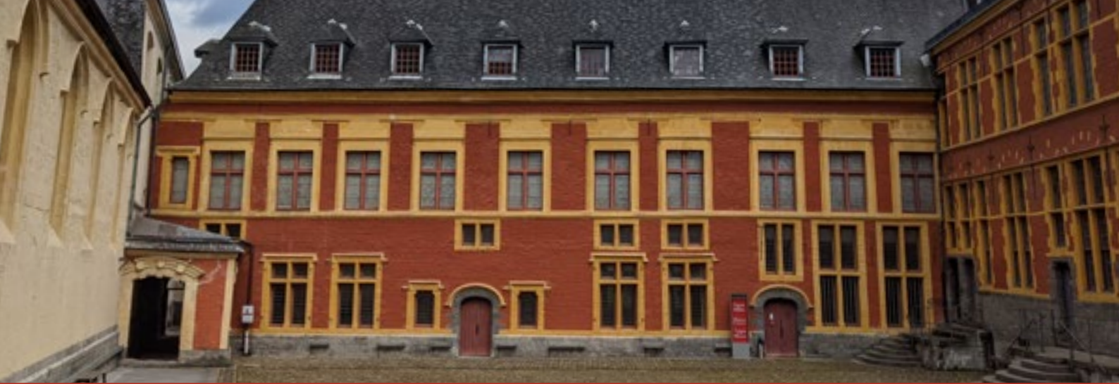
Bâtiment du dortoir de la communauté