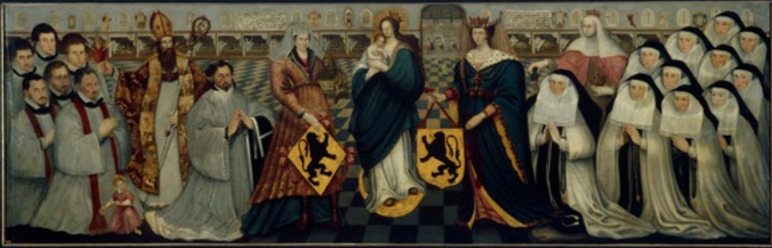
La fondation de l'hôpital, 1632