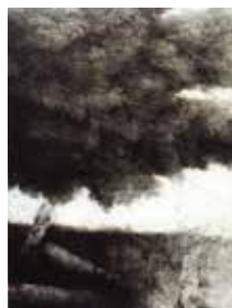
PHOTO 13 : Sous l'arbre, 1997 - eau forte et pointe sèche [135x100cm]