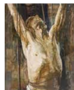
PHOTO 17 : " Corps pendu " (détail, vue de face), 2016 - tempera, collage et acrylique sur papier [100x140cm] - En cours de réalisation dans l'atelier de l'artiste