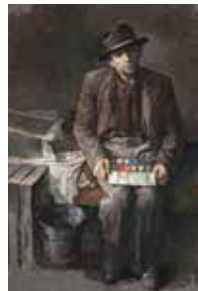
PHOTO 6 : L'aquarelliste, 2005 - huile sur toile [200x180cm]