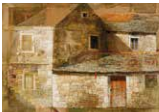
PHOTO 8 : Maison de pierre avec la cour, 2015 - tempera et collage sur toile [160x120cm]