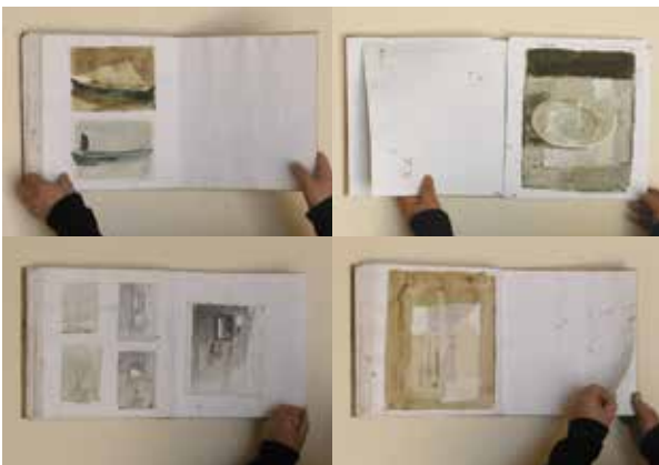
Pages de carnets - aquarelle et tempera sur papier [30x32cm]