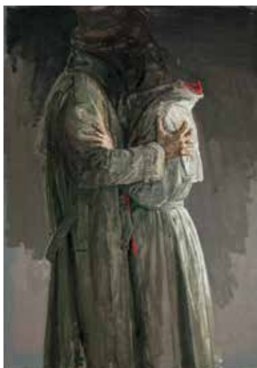
Départ (détail), 2009 - Huile sur toile - ©Francesco Allegretto

Cet automne, le Musée de l'Hospice Comtesse expose les dernières créations de l'artiste bosniaque Safet Zec. Les œuvres présentées, réalisées pour l'essentiel après 2000, dévoilent quinze années de réflexion et de passion autour de l'art de peindre, de figurer le réel, de restituer le monde avec profondeur et intensité.