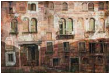
PHOTO 1 : Façade vénitienne, 2010 - tempera, collage et acrylique sur papier [210x400cm]