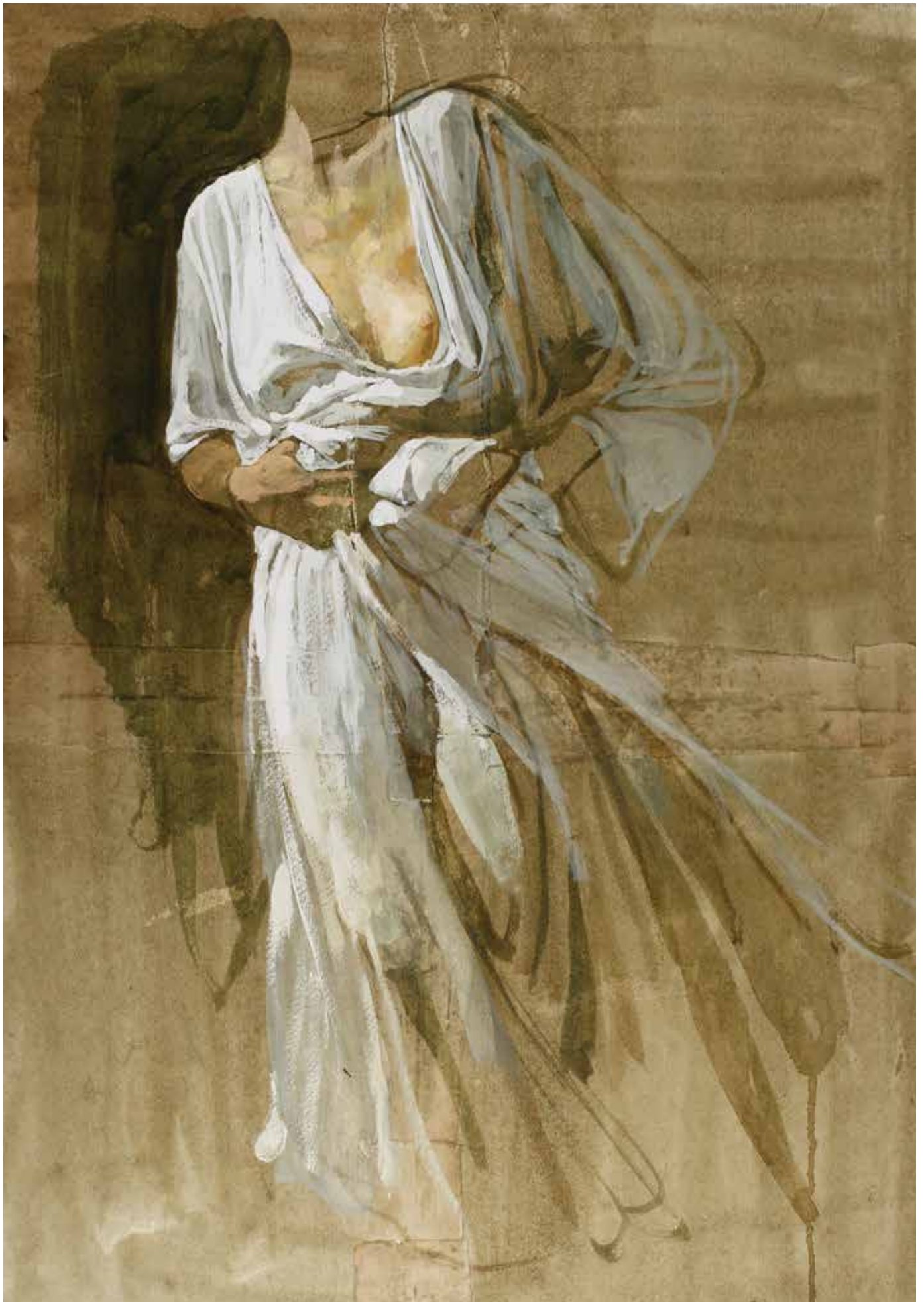
Etude d'après la Victoire de Samothrace, 2015 - aquarelle, tempéra et collage sur papier sur toile [50x70cm]