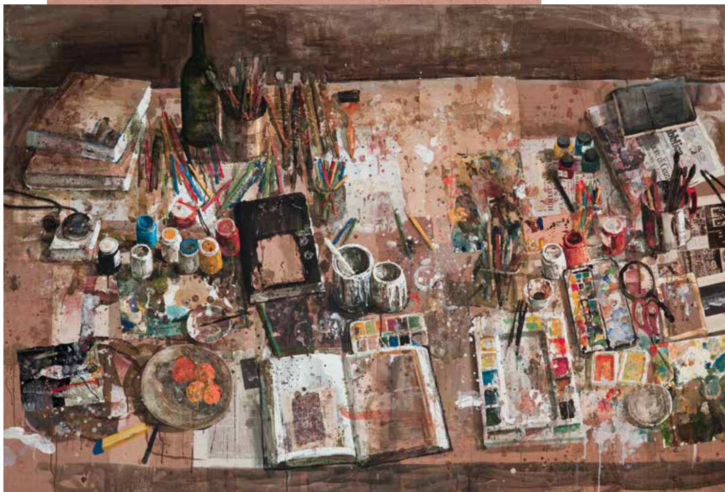
Table du peintre, 2009-2010 - tempera et collage sur papier [160x220cm]