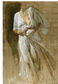
PHOTO 10 : Etude d'après la Victoire de Samothrace, 2015 - aquarelle, tempera et collage sur papier sur toile [50x70cm]