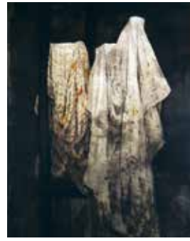
PHOTO 3 : Drap sur le cheval, 1998 - aquatinte et eau-forte [135x100cm]