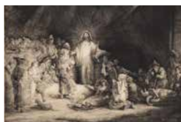
PHOTO 16 : Hommage à Rembrandt - eau forte et pointe sèche [60x80cm]