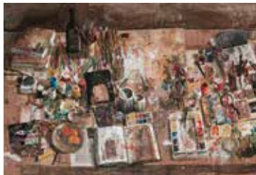
PHOTO 5 : Table du peintre, 2009-2010 - tempera et collage sur papier sur toile [160x220cm]