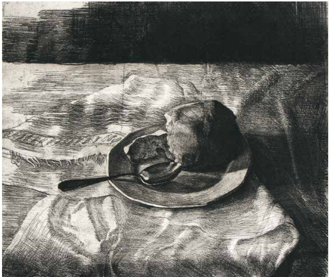
Assiette, cuillère, pain - vernis mou et pointe sèche [70x100cm]