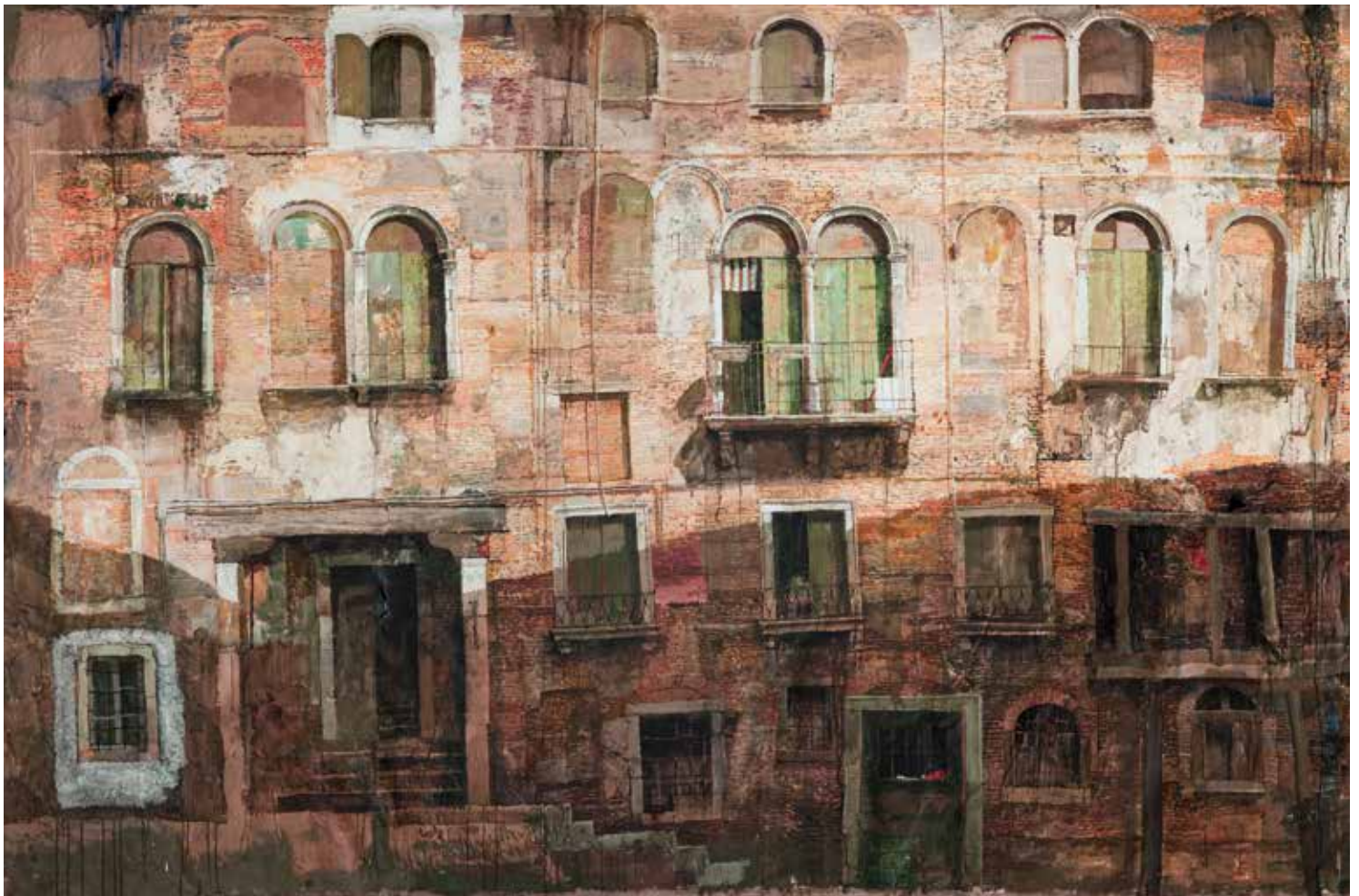
Façade vénitienne, 2010 - Tempera et acryliques sur papier [210x350cm]