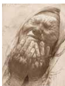
PHOTO 15 : Mains sur le visage - vernis mou et pointe sèche [70x50cm]