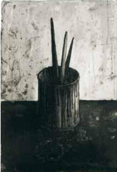
Pot et pinceaux, 2009 - aquatinte et pointe sèche [70x50cm]