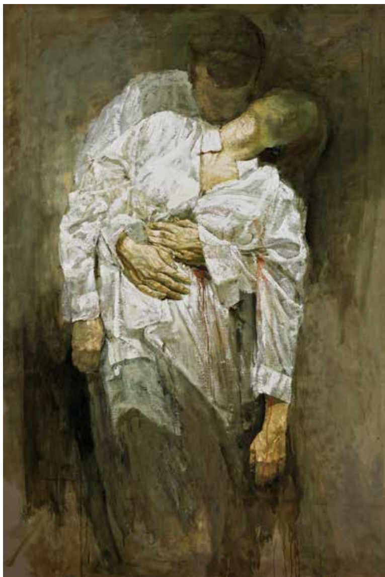
Corps couvert, 2011 - aquarelle et tempera sur papier toile [220x160cm]