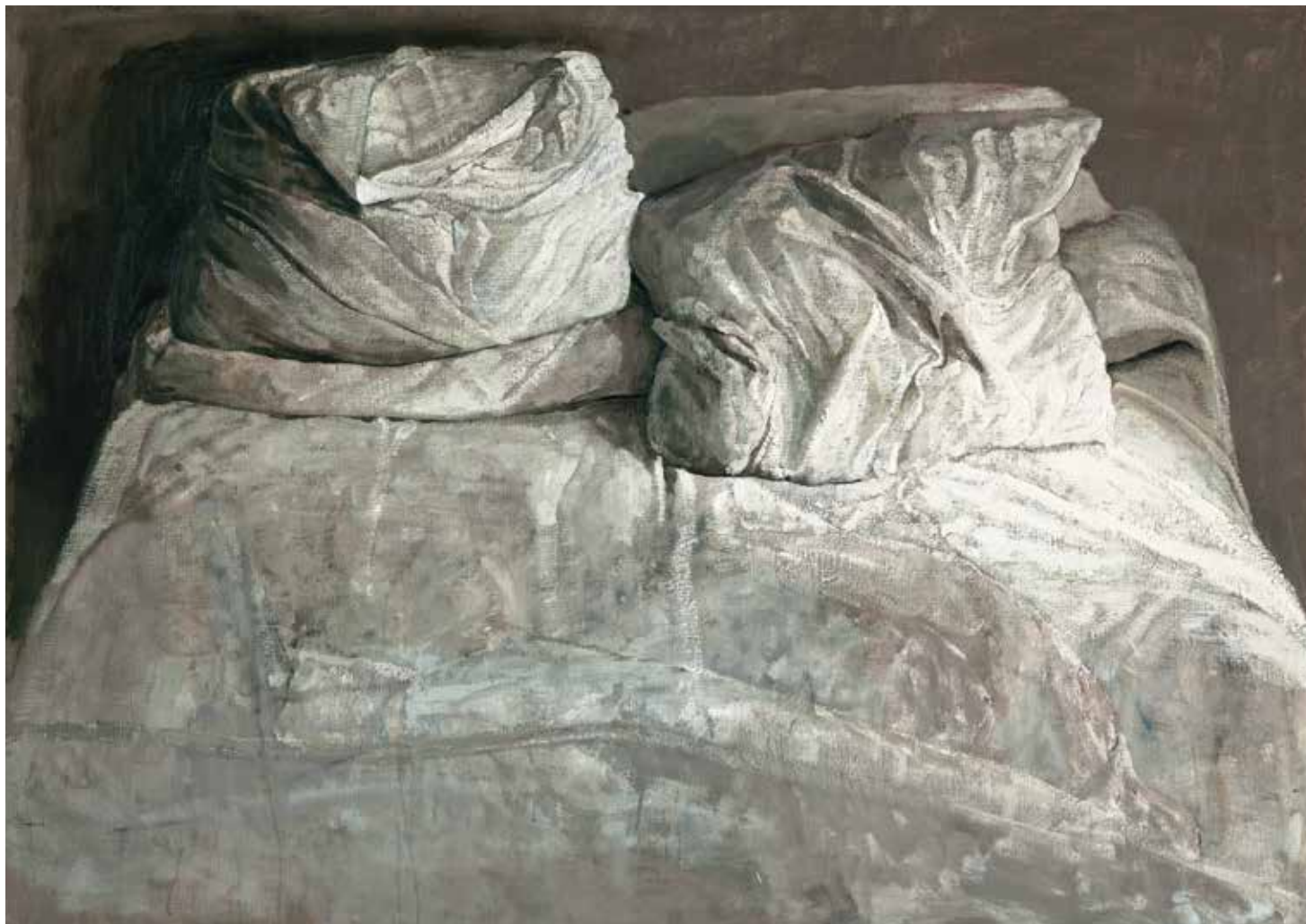
Oreillers, 2008 - huile sur toile [160x220cm]