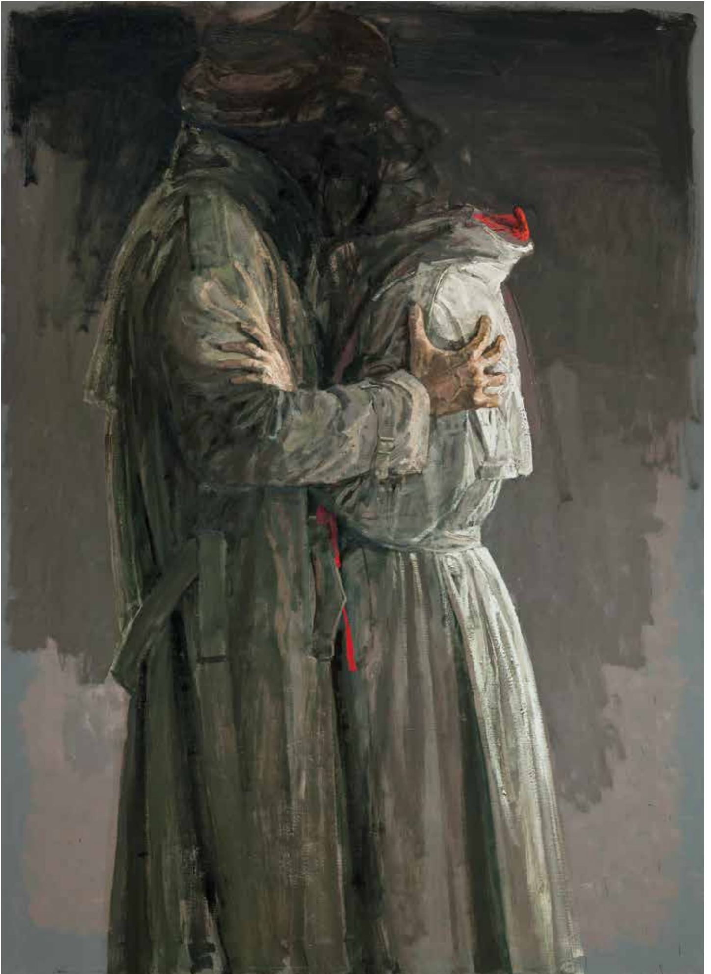
Départ (détail), 2009-2010 - huile sur toile [220x160cm]