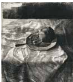
PHOTO 12 : Assiette, cuillère, pain - vernis mou et pointe sèche [70x100cm]