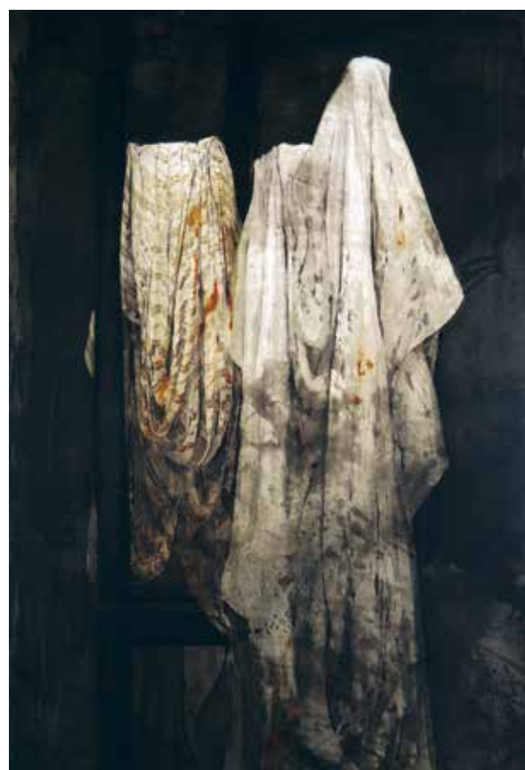
Drap sur le chevalet, 1998 - aquatinte et eau-forte [135x100cm]

« L'homme s'est absenté : il prend le temps de respirer, de réfléchir ; le temps de sourire. Il s'est absenté pour faire du temps, comme on dit en espagnol, Hacer tiempo. » Jorge Semprun