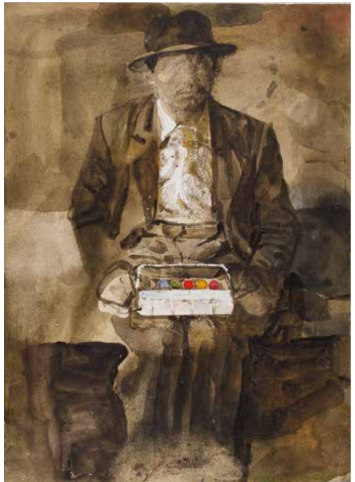
Étude pour aquarelliste, 2005 - tempera et collage sur papier [30x40cm]