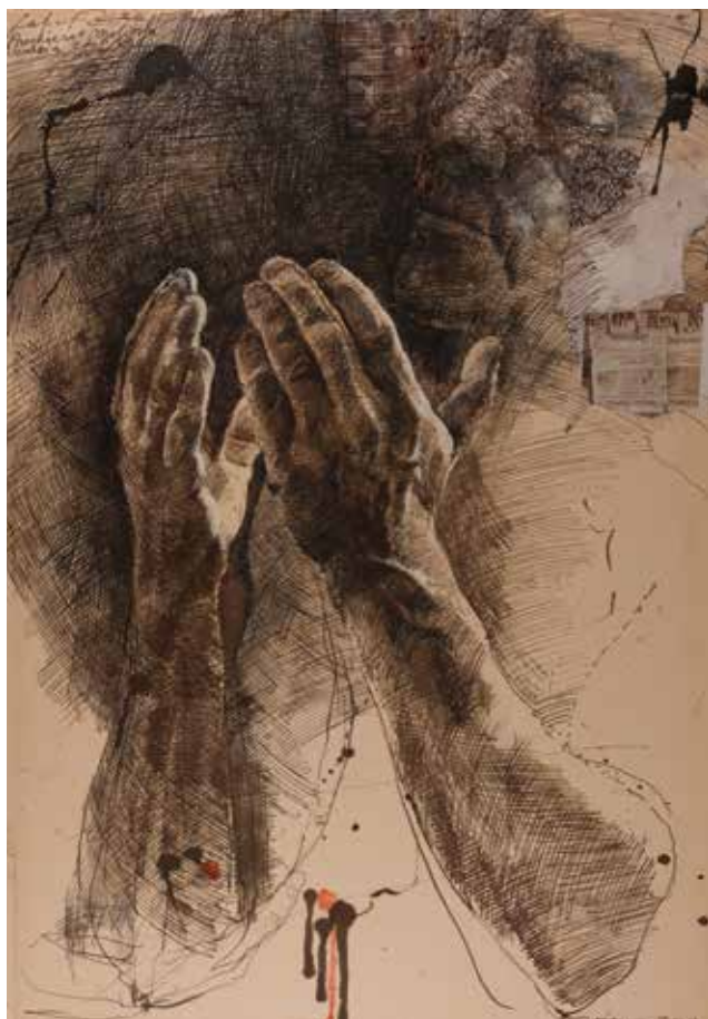
Mains pour la prière, 2008 - encre de chine et collage sur papier [50x35cm]