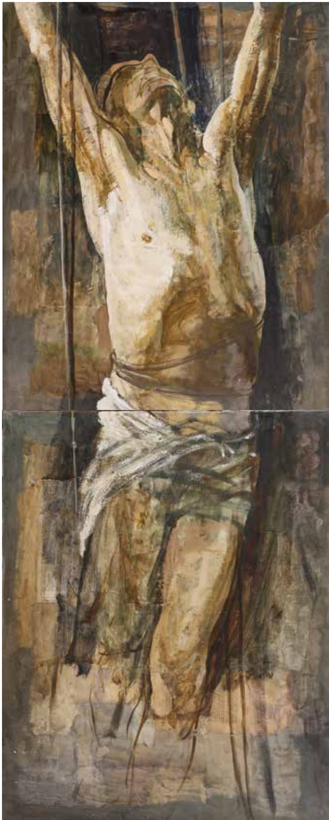
" Corps pendu " (vue de face), 2016 - tempera, collage et acrylique sur papier [200x140cm] - En cours de réalisation dans l'atelier de l'artiste

Ses oeuvres « (...) renferment sans aucun doute la tension mise par Zec à faire de sa peinture un langage total, un grand théâtre de représentations sacrées et profanes (...)» Giandomenico Romanelli