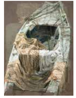
PHOTO 4 : Drap sur le cheval, 1998 - aquatinte et eau-forte [135x100cm]