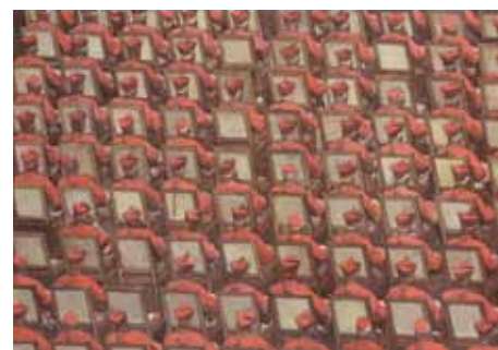
Conclave, 2008 - Pierre noire, aquarelle et gouache et tempera sur vergé (46,8 x 65,3 cm) E. DESMAZIERES : Image 17