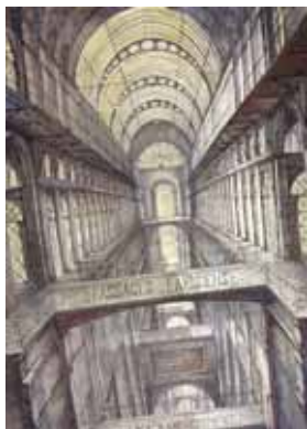
Frontispice des «Passages parisiens, projets d'agrandissements», 1991 - Eau-forte avec roulette et aquatinte rehaussée (61,8 x 44,6 cm) E. DESMAZIERES : Image 10