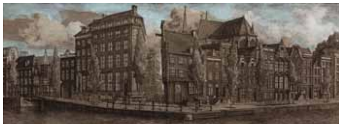
Herengracht, 2004 - Eau-forte avec roulette et aquatinte, aquarellée et gouachée (21,7 x 56,6cm) E. DESMAZIERES : Image 11