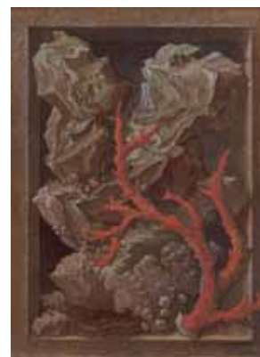
Bibliotheca Abscondita 3, 2009 - Plume, pierre noire, aquarelle et gouache (26 x 18 cm) E. DESMAZIERES : Image 14