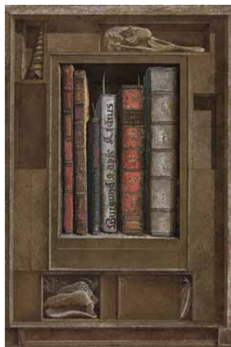
Fragment de la bibliothèque de Sir Thomas B. 2009 - 2013 - Eau-forte avec roulette et aquarelle sur vergé brun avec rehauts de pierre noire, plume, aquarelle et gouache.