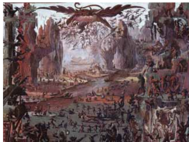
La Tentation de saint Antoine, 1993 - Eau-forte