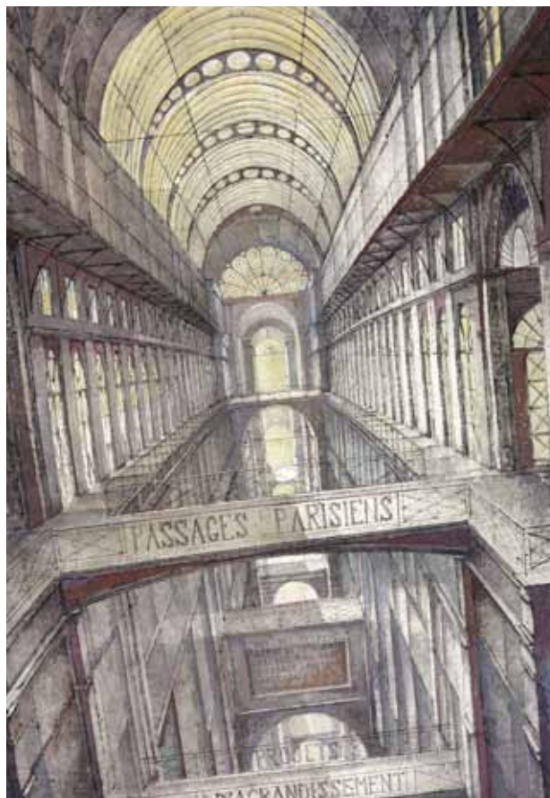
Frontispice des « Passages parisiens, projets d'agrandissements », 1991 - Eau-forte avec roulette et aquatinte rehaussée

L'infinitude – intemporelle, spatiale et livresque - des bibliothèques fascine Érik Desmazières. Aussi, quand Les Amis du Livre contemporain lui passent commande, leur propose-t-il d'illustrer « La Biblioteca de Babel ».