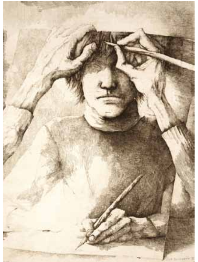
Autoportrait, 1976 - Eau-forte

Érik Desmazières concourt également au rayonnement de l'estampe, au sein de la Société des Peintres Graveurs Français qu'il préside depuis 2006, et de l'Académie des Beaux-Arts dont il a été élu membre de la section de gravure en 2008.