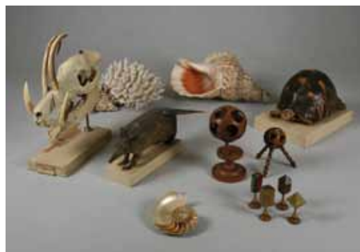
Collections scientifiques du Musée d'histoire naturelle de Lille