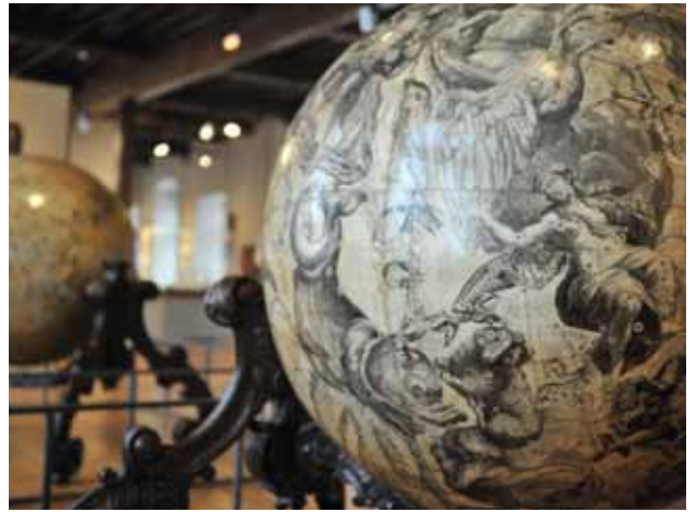
Globes céleste et terrestre, V. Coronelli - 1653 (estampe sur papier) - © Ville de Lille

Quelques objets issus des collections du Musée de l'Hospice Comtesse et du Musée d'histoire naturelle donnent chair aux inventions de l'artiste. Tels les fameux globes du cartographe vénitien Vincenzo Coronelli (XVII e ) dont le Musée possède une version réduite de ceux conservés à la Bibliothèque nationale de France et qui ont inspiré à Olivier Rolin et Érik Desmazières le livre « Une invitation au voyage » (2006). Ces mises en parallèle reposeront aussi sur les polyèdres, coraux et autres spécimens animaliers - motifs indéniables notamment dans les Wunderkammern mis en scène par le graveur - sortis pour l'occasion des riches collections scientifiques* du Musée d'histoire naturelle de Lille.