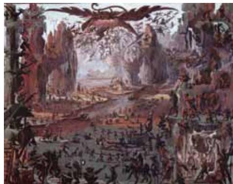
La Tentation de saint Antoine , 1993 - Eau-forte avec aquarelle et gouachée sur vergé appliqué (74,2 x 91 cm) E. DESMAZIERES : Image 9