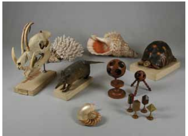
Collections scientifiques du Musée d'histoire naturelle de Lille

* Les collections du Musée d'histoire naturelle de Lille regroupent des ensembles liés à la compréhension du vivant (zoologie), à l'histoire et l'évolution de la Terre (géologie), à la diversité des cultures (ethnographie extra-européenne) mais aussi à l'histoire industrielle régionale (sciences et techniques). Toutes trouvent leur origine dans l'histoire intellectuelle lilloise, puisqu'elles sont issues de travaux de sociétés savantes, du développement universitaire mais aussi de la passion de collectionneurs du XIX e siècle. Elles sont réunies dans le bâtiment de la rue de Bruxelles depuis 1990 et forment un ensemble riche de 450 000 objets et spécimens qui illustrent les liens entre l'Homme et son environnement.