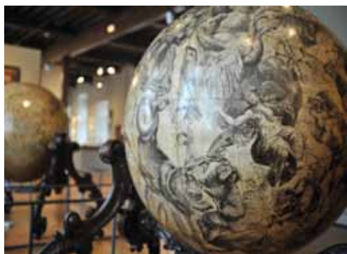
Globes céleste et terrestre, V. Coronelli - 1653 (estampe sur papier)