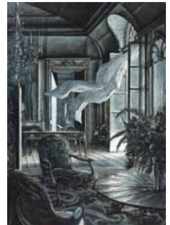
« Le vent souffle où il veut » , 1989 - Eau-forte avec roulette et aquarelle sur vélin, impression bleu (41,4 x 29,7 cm) E. DESMAZIERES : Image 7