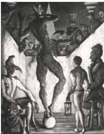
La Danse du diable , 1992 - Eau-forte Eau-forte avec roulette et aquarelle sur vélin (34,5 x 28,6 cm) - Photo : R. Caussimon E. DESMAZIERES : Image 8