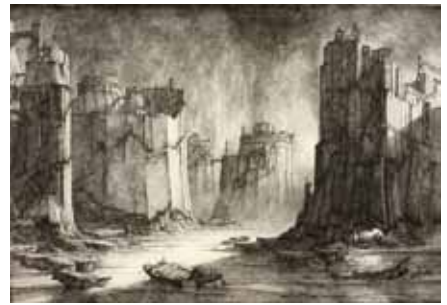
Terres inconnues , 1981 - Eau-forte sur Chine appliquée (41,4 x 59,7 cm) - E. DESMAZIERES : Image 4