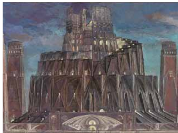
La Tour de Babel, 1997-2002 - Eau-forte et aquarelle rehaussée