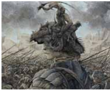
Chef de guerre , 1982 - Eau-forte avec aquarelle et gouachée sur vergé appliqué (19,8 x 24,7) - E. DESMAZIERES : Image 3