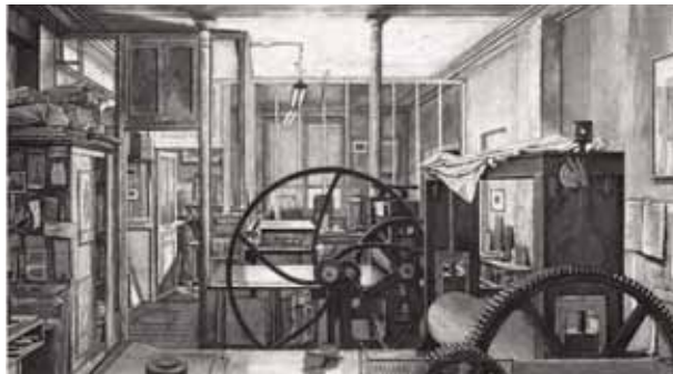
Atelier René Tazé VII , 2006 - Eau-forte avec roulette et aquarelle sur vélin (44,6 x 82,4 cm) - E. DESMAZIERES : Image 6