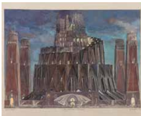
La Tour de Babel ou l'Entrée de la Bibliothèque, 1997 et 2002 - Eau-forte et aquatinte aquarellée et gouachée (30,5 x 49,2 cm) - Photo : R. Caussimon - E. DESMAZIERES : Image 13