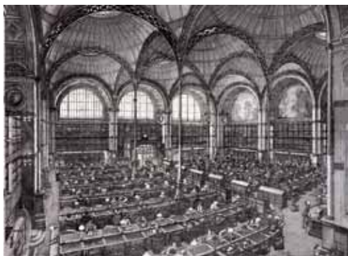
La Salle Labrouste de la Bibliothèque Nationale, 2001 - Eau-forte avec roulette et aquatinte sur vélin (71,6 x 99,2 cm) E. DESMAZIERES : Image 12