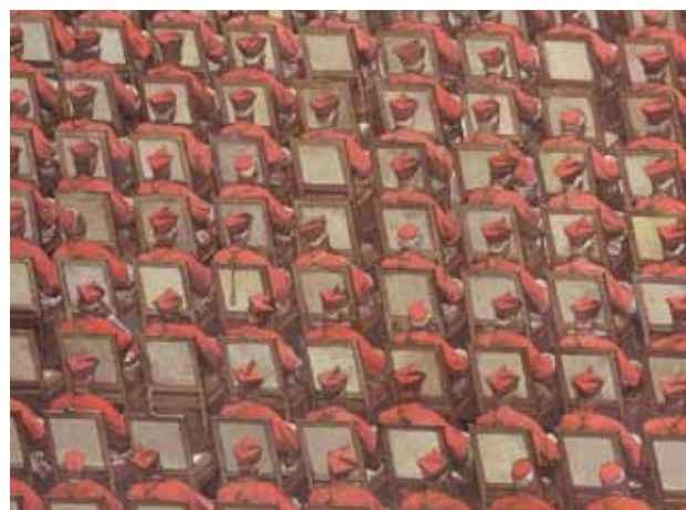
Conclave, 2008 - Pierre noire, aquarelle, gouache et tempera