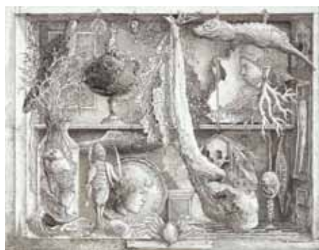
Scarabattolo 2009 - Mine de plomb, plume, pinceau, lavis d'encre de Chine sur vélin (28,4 x 38,2 cm) E. DESMAZIERES : Image 16