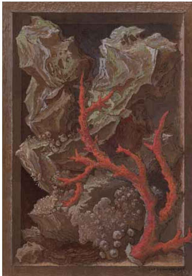
Bibliotheca Abscondita 3 , 2009 - Plume, pierre noire, aquarelle et gouache (26 x 18 cm)

Autoportraits ici, signatures ailleurs, Érik Desmazières aime à glisser ses mains dans ses œuvres. S'il lui est arrivé au début de sa carrière d'esquisser sur le vif et dans l'intimité de ses carnets de dessins les portraits de ses proches, rares sont toutefois ses portraits et autoportraits gravés. Celui de 1976 lui plaît toujours, son histoire aussi. Alors qu'il entreprend la copie du Capriccio 1 de Piranèse, saisi par son reflet dans la brillance du vernis de protection qu'il vient d'appliquer sur le dos de la plaque, il en oublie son travail de copiste et se met à dessiner à même le cuivre ce miroir de lui-même, ses mains de graveur en train de graver son portrait.