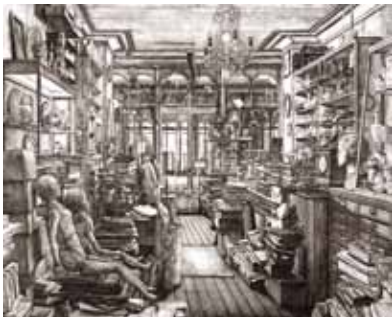
Le Magasin de Robert Capia , 2007 - Eau-forte avec roulette et aquarelle sur vélin (71,3 x 89,5 cm) E. DESMAZIERES : Image 5